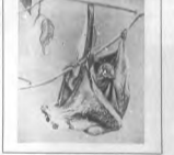
La Perrea o Perrea, según se anunció Kircher este invento...

La obra a que hago referencia y de la cual poco se sabe en... (text partially obscured)