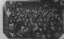
En un momento de la recepción en la ciudad de St. Paul, Minnesota, en la ciudad de St. Paul, Minnesota, cuando se le está haciendo la bienvenida en la ciudad de St. Paul.