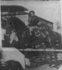
King David, vencedor del Handicap del Otoño en caballo de feria.

El gran establo Kingman que conserva los honores en el Handicap Independence de verano por haber ganado a los franceses.