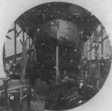
La planta de la zona de construcción del Comodoro Naval Central y el Comodoro Central de guerra.