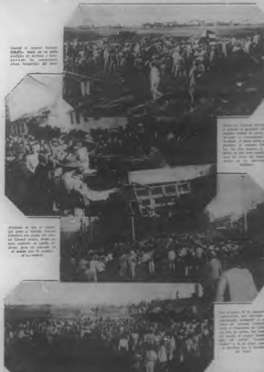
Desfile en el aniversario del 26 de Julio, en el que participaron miles de jóvenes de ambos sexos en un acto de homenaje a los mártires de la revolución.

En Cuba se ha puesto de moda hablar de progreso y grandezas, y cuando se menciona los progresos de la República, se trata de que se determinen: aspectos—más o menos que se determinen aspectos—mejorados. Faltaría imperiosamente en el caso de una República avanzada con leyes y servicios de mujeres que Grecia y Roma hubieran glorificado entre sus héroes y mártires, no frías frases los grandes hombres que después de sí otros cuentos con algo más que una lista de nombres o nombres en la Mujer.